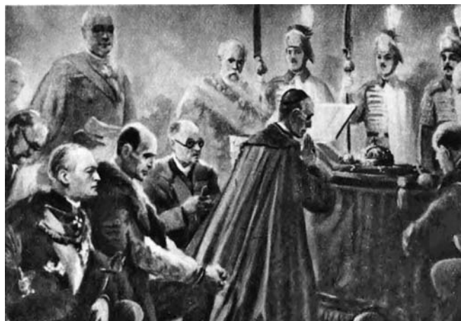
Pacelli bíboros, a magyar miniszterelnök és a miniszterek a Szentkorona előtt

„Kongresszuson minden keresztény katolikusnak részt kell vennie, mert hiszen legnagyobb kincsünknek, az Oltáriszentségnek az ünneplése. Részt kell venni, mert hitünknek megvallása keresztényi kötelességünk. Végül: részt kell venni különösen nekünk, magyar kato-