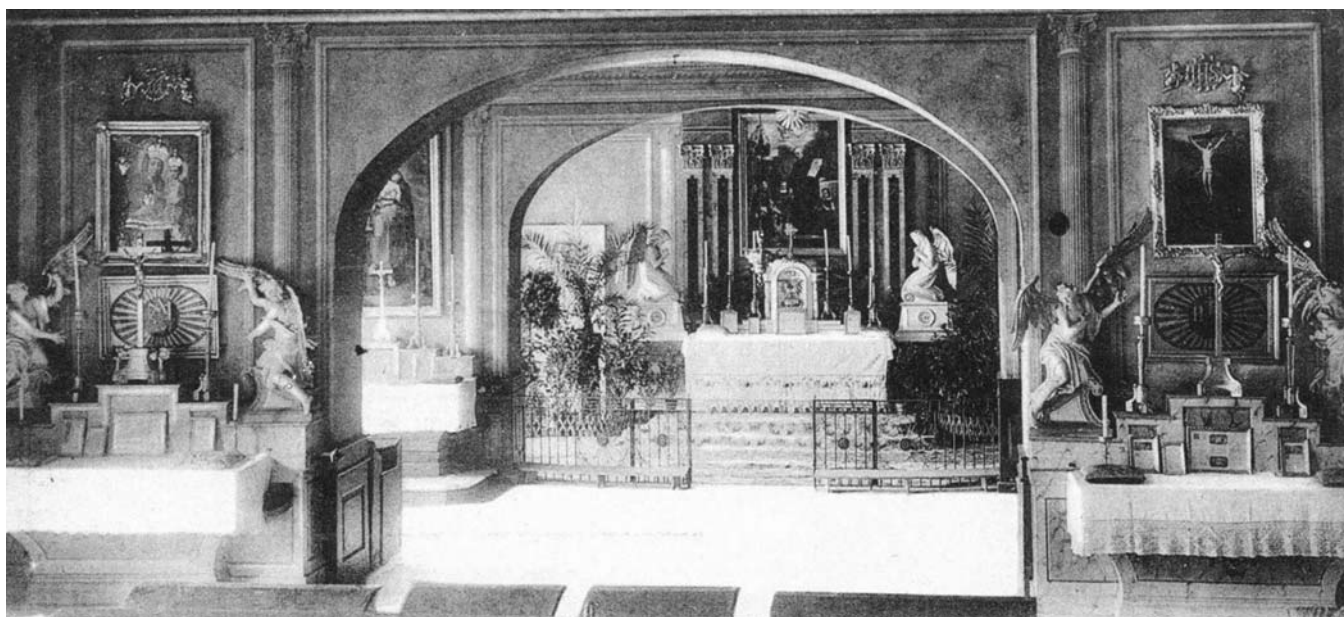
PIARISTÁK ANNO... Az 1761-ben felszentelt régi pesti piarista kápolna