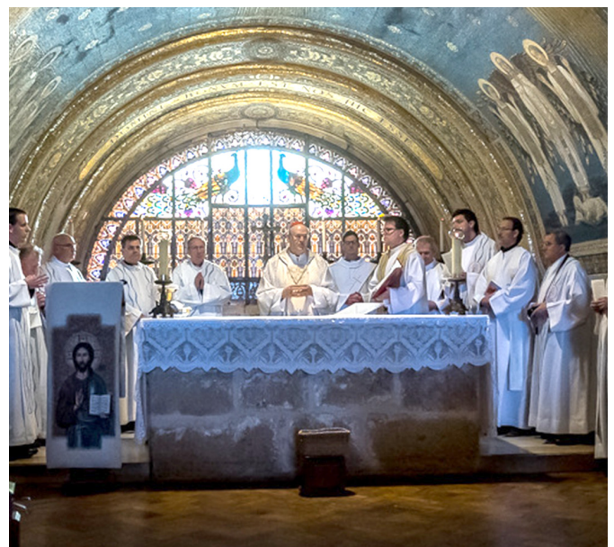
dr. Erdő Péter bíboros atya, volt piarista diáktársunk szentmisét mutat be a Szentföldi papi zarándoklaton