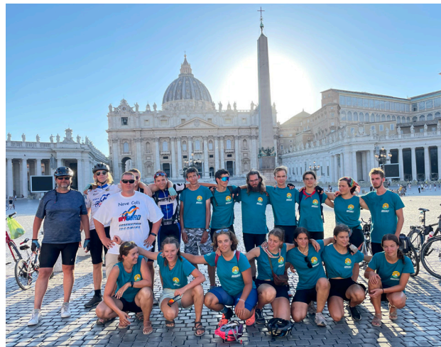
A bicajos zarándokok a Szent Péter Bazilikánál Rómában

Az egészet elmesélni lehetetlen, összefoglalni is nehéz. 13 nap tekerés, napi 100-120 km Alpokon, síkságon, Appenineken keresztül. Amikor már feladni készülnél, hirtelen meglátsz egy vízest, gyönyörű tájat, vagy egy hegycsúcsot, esetleg már a Róma-táblát, és rájössz: megérte. Olyan helyeken és városokban jártunk, ahova sosem gondoltam, hogy eljuttok, nemhogy biciklivel.